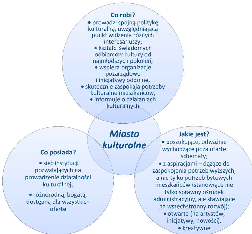
Rys. 1. Miasto kulturalne w ujęciu badanych