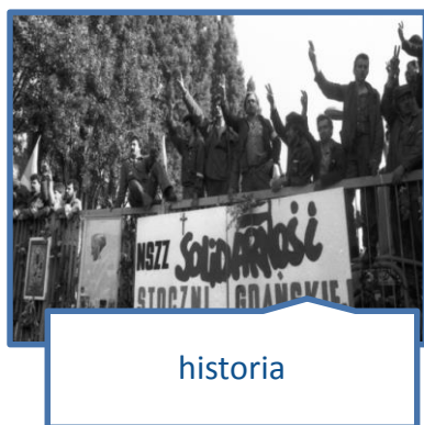
Rys. 2. Gdańsk – spontaniczne skojarzenia

Trzecią grupę kluczowych skojarzeń tworzą odpowiedzi związane z życiem kulturalnym Gdańska. Badani spontanicznie wymieniali wydarzenia (Jarmark Dominikański, koncerty organowe w Gdańsku Oliwie, festiwale) i instytucje kulturalne (Gdański Teatr Szekspirowski, Teatr Wybrzeże, Instytut Kultury Miejskiej, Filharmonię Bałtycką, Centrum Sztuki Współczesnej „Łaźnia”), rzadziej twórców (Paweł Huelle, Stefan Chwin, Tymon Tymański) i poszczególne dziedziny kulturalne (teatr, muzykę awangardową, literaturę).