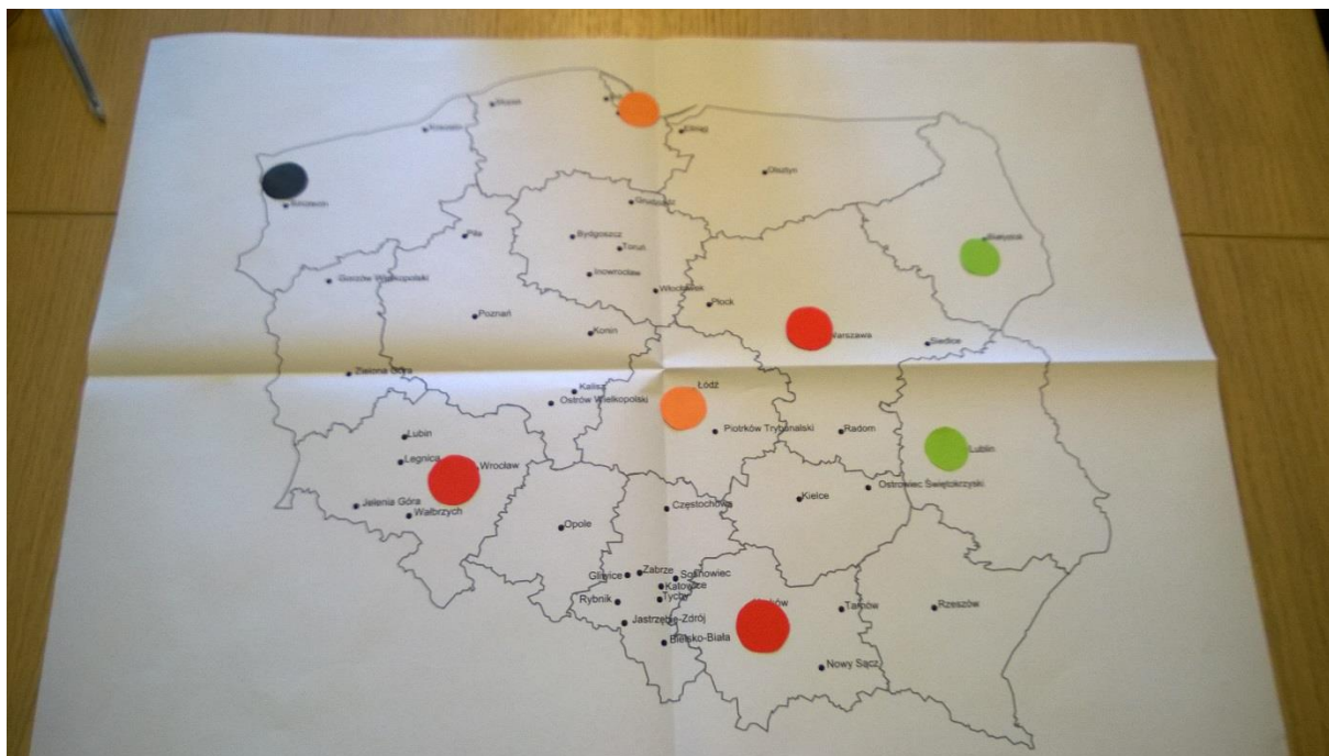
Rys. 3. Zadanie „Barometr kultury” – mapy respondentów z Warszawy (grupa I)

Część osób sytuuje Gdańsk w grupie miast z potencjałem, rozwijających się kulturalnie (oznaczając go kolorem zielonym). Należy zaznaczyć, że badani, którzy wahali się jaką etykietę przyznać Gdańskowi, najczęściej finalnie oznaczali go kolorem innym niż czerwony (a więc przynależny liderowi), co pozwala postrzegać Gdańsk w kategorii miast aspirujących do grupy miast-liderów.